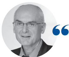
Guy QUILLÉVÉRÉ Président du tribunal administratif d'Orléans

Face à l'augmentation de 3 % des recours déposés par les justiciables, le tribunal administratif s'est adapté au cours de l'année 2020 si particulière pour assurer pleinement la continuité du service public de la justice. Le télétravail a été renforcé dès que possible, avec l'évolution dans l'urgence des méthodes et de l'organisation du travail, tout en garantissant un accueil du public dans les salles d'audience, sous réserve du respect des jauges et des gestes barrières et de distanciation. Ainsi, les circonstances particulières ont été une opportunité pour contribuer à l'accélé-